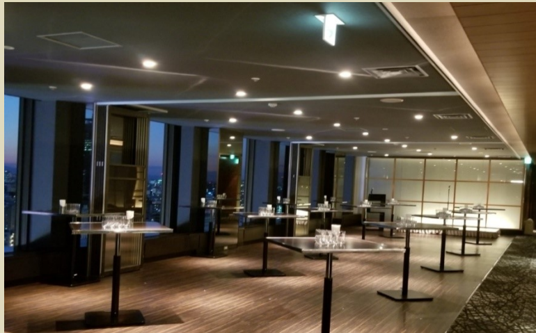
【バーエリア (夜)】※写真は立食イメージです。 貸切り・人数に合わせてアレンジいたします。