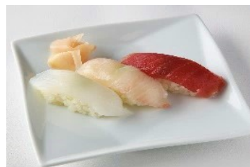
おすすめの逸品【握り寿司】

瓶ビール、ワイン(赤・白)、焼酎(麦・芋)、ウイスキー(ハイボール)、 日本酒(冷)、オレンジジュース、ウーロン茶