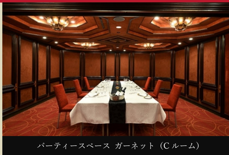
パーティースペース ガーネット (C ルーム)