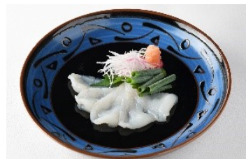
おすすめの逸品【河豚の薄造り】

スパークリングワイン、瓶ビール、ワイン(赤・白)、 ウイスキー(ハイボール)、日本酒(冷)、焼酎(麦・芋)、カクテル2種、 コーラ、ジンジャーエール、オレンジジュース、ウーロン茶