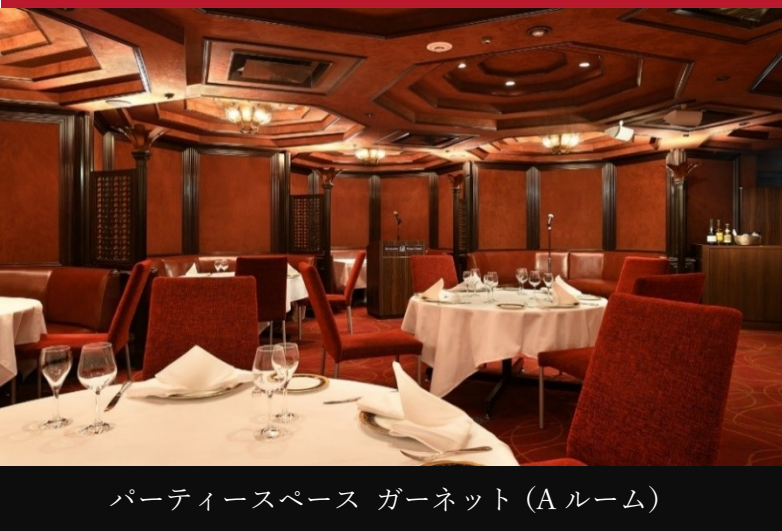
パーティースペース ガーネット (A ルーム)