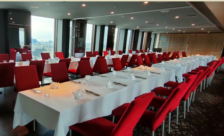
【バーエリア (昼)】※写真着席イメージです。 ごゆっくりお食事をお楽しみください。