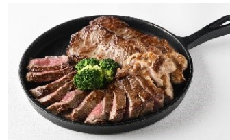
おすすめの逸品【牛ステーキ】

スパークリングワイン、瓶ビール、ワイン(赤・白)、焼酎(麦・芋)、ウイスキー(ハイボール)、日本酒(冷)、オレンジジュース、ウーロン茶